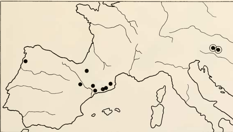
Abb. 1: Bekannte und neue Fundpunkte (umringt) von Anisochrysa inornata (Navas).

Anisochrysa inornata war nach Hölzel & Ohm 1972 und Hölzel 1973 bisher nur aus dem weiteren Pyrenäen-Bereich (Spanien und Frankreich) und aus Nordostspanien bekannt (Abb. 1). Weitere Meldungen aus Südfrankreich und Holland konnten bislang nicht bestätigt werden, rücken aber durch die Neunachweise in Österreich in den Bereich des Möglichen.